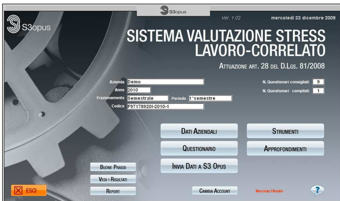
Schermata principale del software

SVS - Sistema Valutazione Stress - è un sistema di nuova generazione, in grado di effettuare in maniera completamente automatica, senza dispendio di tempi e costi, la valutazione del rischio stress lavoro-correlato, tramite il semplice inserimento di dati aziendali e dati soggettivi rilevati attraverso un apposito questionario (QSLC).